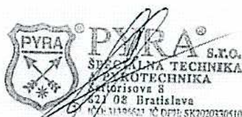
Ján APPEL konateľ