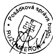
Ján Belan zhotoviteľ

JÁN BELAN BVI - ALARM SYSTEM L. LÚČKA IČO: 14 217 554 IČ DPH: SK1020536132