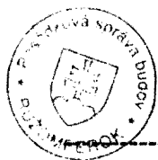
Ing. Tomka Vladimír objedávateľ

JÁN BELAN BVI - ALARM SYSTEM L. LÚČKA IČO: 14 217 554 IČ DPH: SK1020536132