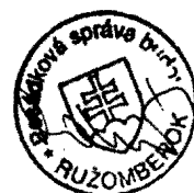
Kurej Pavol zhotoviteľ

Bitarová 145, 010 04 ŽILINA Prevádzka: Moyzesova 23, 010 01 ŽILINA Tel./fax: 041/7233464 IČO: 10943455 IČ DPH: SK1020529609 č. Živn. registra 511-3328, DIČ: 1020529609