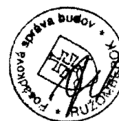
p. Marián Turan zhotoviteľ

21-07-2008 MT-výtahy, s.r.o. Likavka 185 IČO:36421235, DIČ:2021857816 tel: 044/4328 118