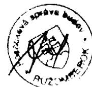
Ján Belan zhotoviteľ

JÁN BELAN BUM - ALARM SYSTEM L. LÚČKA IČO: 14 217 554 IČ DPH: SK102053612