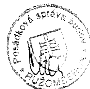
p. Gabriel Šimko zhotoviteľ

GAJOS s.r.o. M. PIŠÚTA 4022, 031 01 LIPT. MIKULÁŠ IČO: 36376881 DIČ: 2020126152 IČ DPH: SK2020126152 tel/fax: 044155 0311