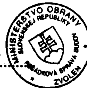
Libor Šimo vedúci skupiny špeciálnych činností Posádková správa budov Zvolen