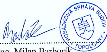
Ing. Milan Barborík vedúci oddelenia PSB Topoľčany

Svojim podpisom overujem totožnosť zmluvy s originálom. Jedná sa o zmluvu č. PSB TO - 4 - 4 / 20 18