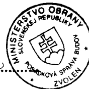
Libor Šimo vedúci skupiny špeciálnych činností Posádková správa budov Zvolen