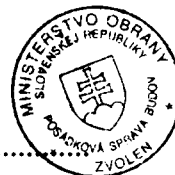
Libor Šimo vedúci skupiny špeciálnych činností Posádková správa budov Zvolen