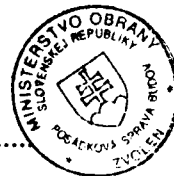
Libor Šimo vedúci skupiny špeciálnych činností Posádková správa budov Zvolen