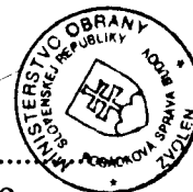
Libor Šimo vedúci skupiny špeciálnych činností Posádková správa budov Zvolen