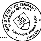
Libor Šimo vedúci skupiny špeciálnych činností Posádková správa budov Zvolen