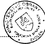
Libor Šimo vedúci skupiny špeciálnych činností Posádková správa budov Zvolen