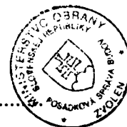
Libor Šimo vedúci skupiny špeciálnych činností Posádková správa budov Zvolen