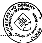
Libor Šimo vedúci skupiny špeciálnych činností Posádková správa budov Zvolen