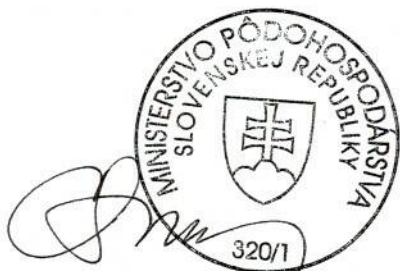
Ing. Vladimír Chovan minister pôdohospodárstva SR